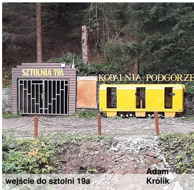
wejście do sztolni 19a

W dzisiejszych czasach kopalnia Podgórze, a dokładniej sztolnia 19a jest udostępniona dla zwiedzających. Trasa turystyczna liczy ok. 1600m, a jej zwiedzanie trwa ponad godzinę. Kopalnię zwiedza się razem ze świetnymi przewodnikami, którzy z wielką pasją opowiadają o jej losach i nie tylko. Na trasie znajduje się wiele wystaw sprzętu górniczego, a także jedna bardzo ciekawa ekspozycja zawierająca szkło barwione uranem, które pod wpływem światła ultrafioletowego zaczyna emitować kolor zielony.